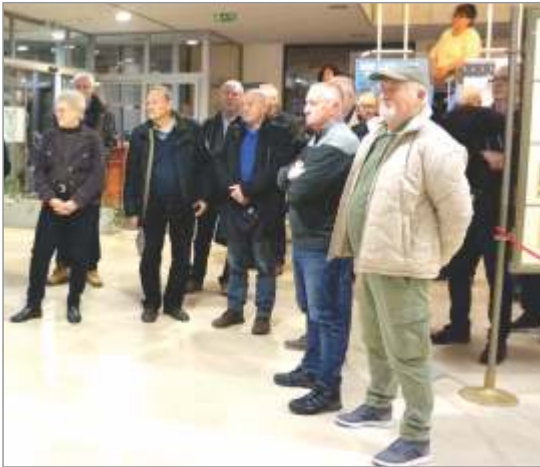
Del članov društva na svečanosti.

Želja je bila ob tem jubileju pripraviti v knjižni obliki kroniko društva od 1933 do 2023, toda zalogaj je precej obširen, čeprav je glavnina napisana. Če ne prej, bomo kroniko poskusili pripraviti do maja 2025, ko bomo slavili 100. obletnico ustanovitve takratnega Filatelističnega krožka.