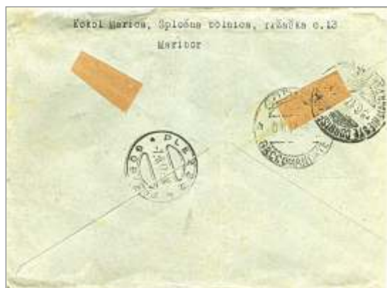
Slika 2. Zadnja stran pisma z obema tranzitnima žigoma: Trst, Gorica. Vidna sta dva koščka lepilnega traku. Nista od cenzure, ampak s pošte. Kot vemo, smo v Jugoslaviji morali priporočena pisma za tujino oddajati odprta!