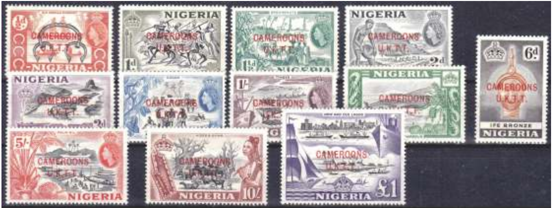
Pretiskane nigerijske znamke

Povzetek: Članek obravnava filatelijo nekdanje nemške kolonije Kamerun, ki so jo zasedle britansko-francoske čete leta 1914 s poudarkom na edini britanski seriji tega območja, izdani ob referendumu leta 1960.