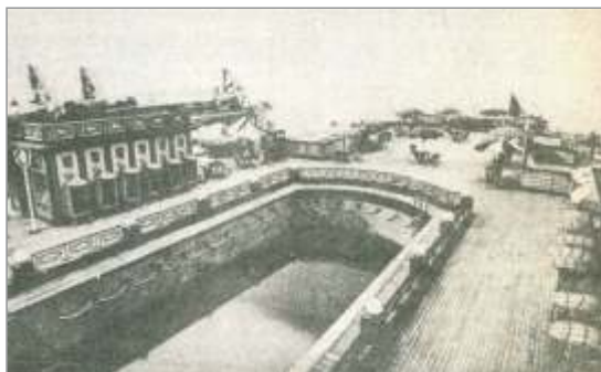
Slika 1. Paluba razkošne ladje Rex.

Letos mineva 80 let od zavezniškega napada na ladjo Rex (iz lat. kralj), ki so jo 8. septembra 1944 bombardirali in potopili ob obali med Izolo in Koprom. Svojo zadnjo vožnjo iz Genove v New York je opravila 9. maja 1940.