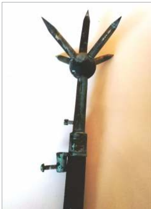
Slika 4. Ladja Rex je imela dva jambora. Na vrhu jambora pa je stal strelovod. Eden od njiju, prikazan na tej sliki, se danes nahaja pri mojem sošolcu v Kopru.