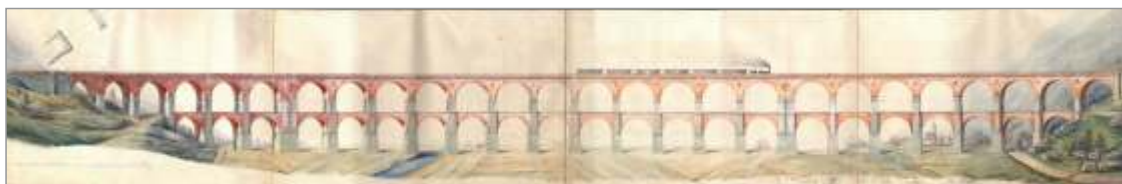
Slika 1: Izvimi načrt za borovniški viadukt Carla von Ghege iz leta 1850.

Borovniški viadukt na železniški trasi Dunaj – Ljubljana – Trst (t.i. južni železnici) je bil eden največjih premostitvenih železniških objektov v Evropi in hkrati edini dvonadstropni viadukt v Sloveniji (slika 1). Viadukt je v dolžino meril 561 m , visok pa je bil 38 m . Projektiranje viadukta je vodil avstrijski gradbeni inženir Benečan Carl von Ghega , ki je bil leta 1851 za svoje zasluge pri izgradnji železniškega omrežja Habsburške monarhije povzdignjen v plemiški stan z nazivom vitez (1) .