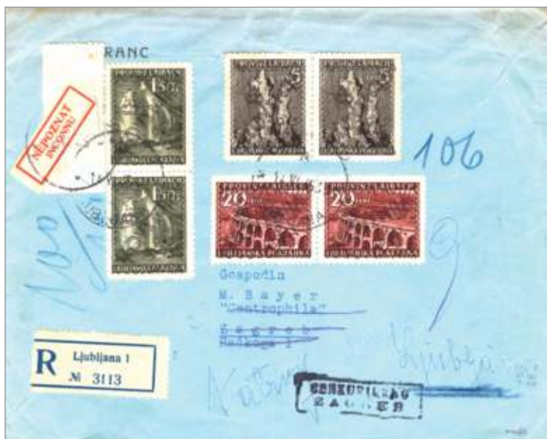
Slika 9: Uporaba znamk pomožne izdaje s pretiskom iz leta 1945 na priporočenem pismu, poslanem iz Ljubljane (iz zbirke dr. Veselka Guština).

Poštno zgodovinsko vrednost in dejansko uporabo pomožne izdaje znamk iz leta 1945 dokazuje priporočeno pismo na sliki 9 . Pismo je frankirano s 6 znamkami v skupni vrednosti 3 lir in 50 centesimov (1,5 L + 1,5 L + 20 cent. + 20 cent. + 5 cent. + 5 cent.) in je bilo 14. junija 1945 poslano iz Ljubljane v Zagreb, kjer je bilo podvrženo cenzuri. Pošta ga je zaradi nepoznanega naslovnika vrnila pošiljatelju. Na njem sta med drugim tudi dve znamki z motivom borovniškega viadukta.