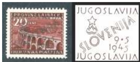
Slika 8: Začasna (pomožna) izdaja s pretiskom iz leta 1945 – borovniški viadukt na znamki za 20 centezimov in predstavitev vsebine pretiska.

Pretiskana znamka z motivom borovniškega viadukta je ohranila prvotno nominalo 20 cent.. V katalogu Slovenika je razvrščena kot začasna izdaja pod številko 3, v katalogu Michel pa pod YU-SLOW-3. V katalogu Michel je navedena naklada v višini 100.400 kosov. Med znamkami iz te pomožne serije je kar nekaj napak z dvojnimi ali obrnjenimi pretiskom, zaradi manjše naklade in s tem večjega zanimanja filatelistov pa je nastalo tudi nekaj ponaredkov, nekateri celo z originalnimi klišeji.