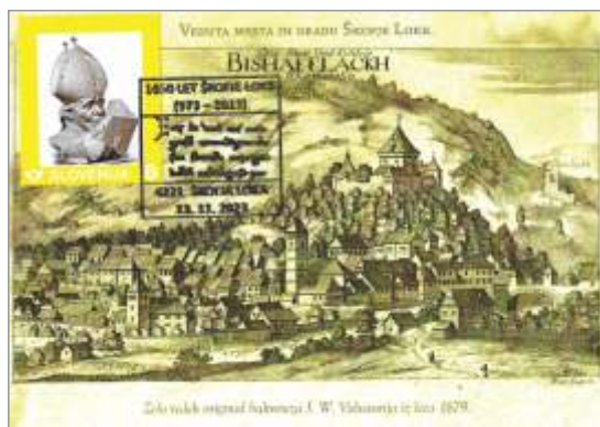
Maksikarta z veduto Škofje Loke

Razstavili smo tudi razglednice Škofje Loke iz vseh državotvornih obdobj, od Avstro-Ogrske monarhije, pa vse do