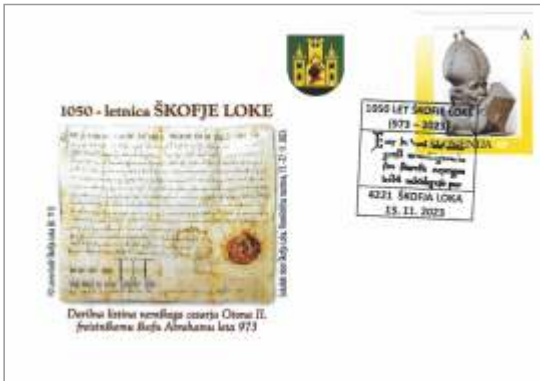
Pisemska ovojnica z motivom darilne listine nemškega cesarja Otona II.