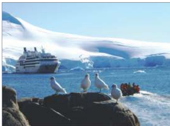
Križarka v pristanišču.

nov ( gentoo penguin – Pygoscelis papua ) in vplive zaradi turističnih obiskovalcev.