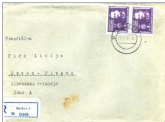
Slika 1. Sprednja stran pisma.

Pozneje se je izobraževala še v Mariboru (Šola gospodinjstva) do leta 1936.