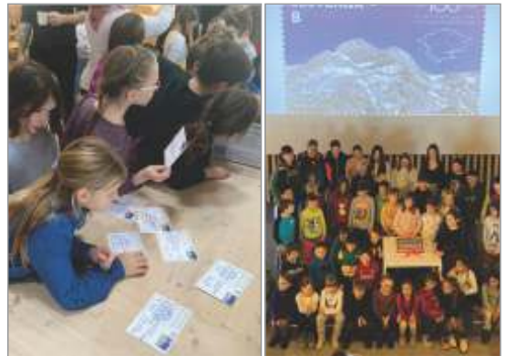
Šolarji so z veseljem napisali sporočila na razglednice, na koncu pa so se postavili še ob „filatelistični“ torti.

Na koncu pa smo bili vsi deležni koščka torte, na kateri je bila podoba nove poštna znamke.