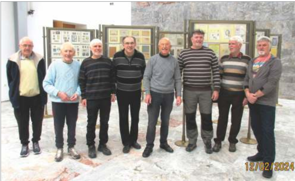
Posnetek članov FD ob postavitvi razstave v počastitev 75-letnice FD Lovro Košir Škofja Loka v Sokolskem domu Škofja Loka.