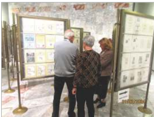
Obiskovalci kulturnih prireditev v Sokolskem domu Škofja Loka si z zanimanjem ogledujejo filatelistično razstavo.

– Matjaž Metaj, Svetovni čipkarski kongres pri nas (2 vitrini); eksponat kronološko prikazuje izdaje Pošte Slovenije in filatelističnih društev. Začne se z izdajo priložnostne znamke, ovitka in žiga prvega dne Pošte Slovenije ob 17. svetovnem čipkarskem kongresu-OIDFA 2016 v Ljubljani, nadaljuje pa se z izdajami tiskane ovojnice in maksimum karte posameznih društev. Na koncu je predstavljen še čipkarski kongres 2023 v Gorici, v sodelovanju z Novo Gorico, in 5. obletnica vpisa Slovenskega klekljanja v seznam neosnovne kulturne dediščine UNESCO.