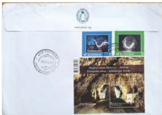
Druga stran pisma, ki je pripotovalo v Postojno z Antarktike.

Port Lockroya. Napisala in podpisala jo je posadka v Port Lockroyu. Poleg rdečega kašeta (štampiljke) Port Lockroya je bila žigosana tudi z žigom jamskega poštnege urada z datumom 26. 01. 2024.