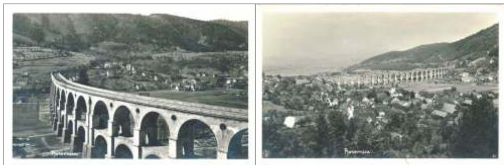
Slika 2: Borovniški viadukt na dveh neodposlanih razglednicah, na desni razglednici iz leta 1923 prikazana Borovnica z župnijsko cerkvijo Sv. Marjete in viaduktom.

Viadukt so pričeli graditi leta 1850, dokončan pa je bil leta 1856. 28. oktobra 1856, tik pred obiskom cesarja Franca Jožefa v Ljubljani, je preko dvotirnega viadukta poskusno zapeljal prvi vlak. Ker je viadukt premoščal globoko zajedo Ljubljanskega barja med Krimskim hribovjem in Menišijo, so ga postavili na brano iz 4.000 hrastovih pilotov, na katere so namestili 24 zidanih stebrov iz podpeškega kamna. Med stebri je bilo v spodnji etaži 22, v zgornji etaži pa 25 opečnatih obokov. Pri gradnji je bilo porabljenih 32.000 m 3 lomljenega kamna, 31.000 m 3 obdelanih kamnitih blokov in približno pet milijonov opek. Ocenjen strošek gradnje je bil 2 milijona goldinarjev, kar bi danes zneslo