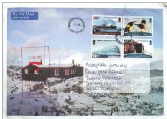
Naslovna stran pisma, poslanega z Antarktike v Postojno.

Na levi strani je žig postaje v rdeči barvi z datumom 16. 12. 2023. Pismo je zapustilo otok 20. decembra 2023 z ladjo MS Roald Amundsen v lasti ladijske družbe Hurtigruten Expeditionen, le-ta jo je v Stanleyu na Falklandskih otokih predala naprej. Le-tu so jo ročno sortirali po deželah, predno je šla naprej z enim od letal, ki leti dvakrat tedensko v RAF Brize Norton v Veliki Britaniji ( Royal Air Force ).