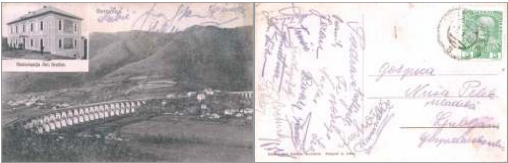
Slika 3: Borovniški viadukt – razglednica, poslana maja leta 1910, frankirana z znamko s podobo cesarja Franca Jožefa za 5 hellerjev, veljavno tarifo za razglednico v notranjem prometu.