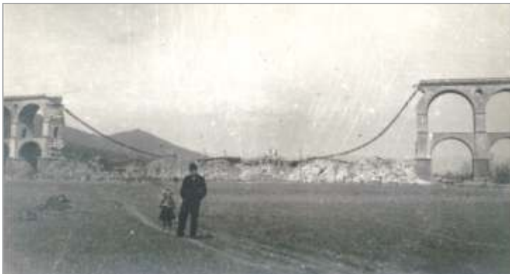
Slika 4: Delno porušen borovniški viadukt aprila 1941

Takoj na začetku 2. svetovne vojne je umikajoča se jugoslovanska vojska 10. aprila 1941 razstrelila del mostu (posledice so vidne na sliki 4 ), a so na manjkajočem delu viadukta italijanski vojaki hitro postavili 223,5 m dolg železen premostitveni most ( slika 5 ), t.i. Roth-Waagnerjevo konstrukcijo (3) in proga je bila ponovno prevozna že 29. junija 1941. Po kapitulaciji Italije (4) so Nemci zaradi nevarnosti vse večjega števila letalskih napadov preventivno zgradili obvozno progo mimo viadukta. Viadukt so med vojno od 25. februarja 1944 naprej večkrat bombardirali zavezniki. Po zadnjem močnem letalskem zavezniškem bombardiranju 28. decembra 1944 deloma zrušenega in neprevoznega viadukta niso več obnovili.