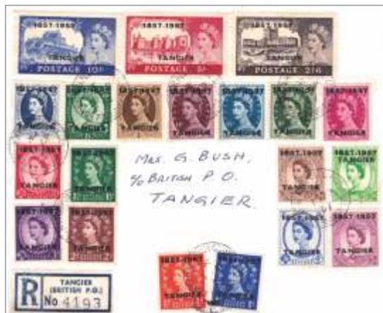
Kompletna serija jubilejnih znamk na kuverti prvega dne

Znamke Tangerja so bile v uporabi tudi v Veliki Britaniji; znamke z britanskim žigom so vredne le pol cene v primerjavi z uporabljenimi v Tangerju.