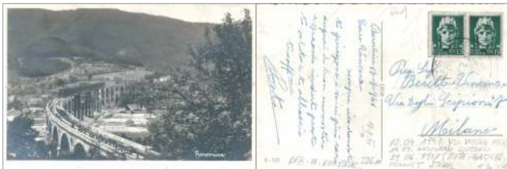
Slika 5: Borovniški viadukt z Roth-Waagnerjevo premostitveno konstrukcijo – razglednica, poslana julija leta 1941, frankirana z 2 znamkama Imperiale za 15 centesimov (5) , kar je bila veljavna tarifa za pošiljanje razglednic v tujino (Milano).

Preostali del viadukta so postopoma do leta 1950 porušili in danes v Borovnici lahko vidimo samo še del kamnitega stebra, ki je bil 22. februarja 1992 razglašen za nepremični spomenik lokalnega pomena. Naj kot zanimivost povem, da so ob pomanjkanju gradbenega materiala po 2. svetovni vojni prebivalci Borovnice in bližnjih krajev opeke iz porušenega mostu očistili in uporabili pri gradnji hiš, iz opeke borovniškega mostu je bila zgrajena tudi hiša mojega dedka v vasi Jezero pri Podpeči.