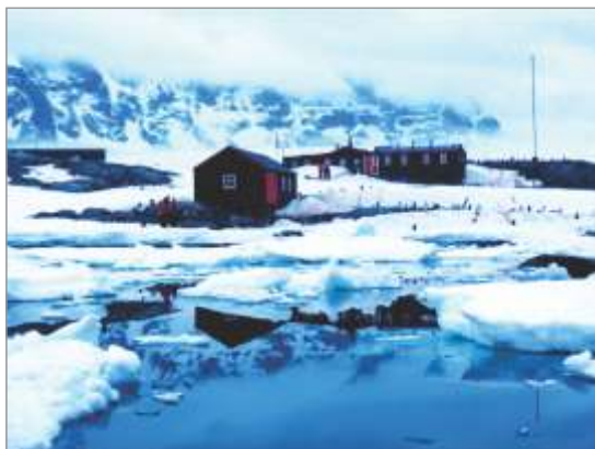
Port Lockroy.

Zaradi zaščite smejo turisti pristopati samo na določene dele otoka in še to po predvidenih poteh. Kot izgleda, vpliva turistični obisk na pingvine pozitivno, saj prisotnost ljudi odganja plenilske galebe. Postaja je zasedena v času antarktikega poletja, tj. od novembra do konca februarja. Na poštnem uradu so na voljo izključno znamke BAT – Britanskega Antarktičnega Ozemlja. V uporabi je tudi poseben poštni žig.