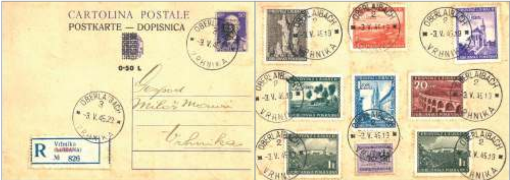
Slika 7: Uporaba znamk iz Ljubljanske pokrajinske izdaje na filatelistično navdahnjeni dopisnici

cerkvijo (1,25 L.), slap v Peklu pri Borovnici (1,50 L.), samostan v Kostanjevici na Krki (2 L.), grad Turjak (2,50 L.), grad Žužemberk (3 L.), Mirna ob reki Krki (5 L.), grad Otočec na reki Krki (10 L.), dolenska kmečka hiša (20 L.), Tabor nad Cerovim pri Grosupljem z utrjeno cerkvijo (30 L.). Znamke so bile natisnjene tiskarni Ljudska tiskarna v Ljubljani na polah po 100 znamk v globokem raster tisku.