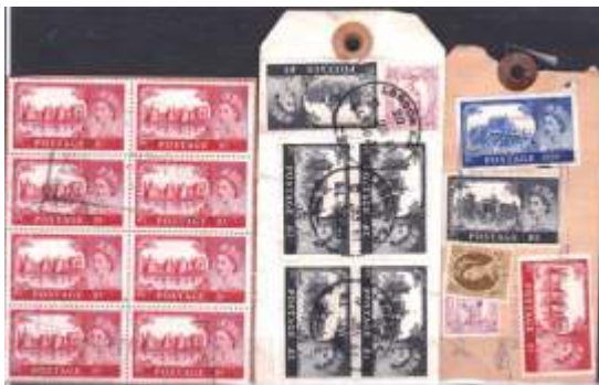
Nekaj primerov uporabe visokih vrednot na paketih

Znamke so se uporabljale zlasti na paketih in težjih letalskih pismih za tujino; oboje je bilo precej dražje kot danes. Večina uporabnikov poštnih znamk teh vrednot ni nikoli videla oziroma imela opravka z njimi.