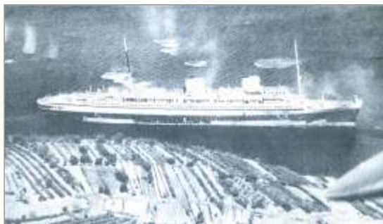
Slika 2. Zadnji trenutki bombardiranja. Desno spodaj se vidi krilo letala, spredaj bombe, ki padajo v morje in na ladjo (slika iz Žusterna, Glasilo krajevne skupnosti Žusterna, oktober, 1999).