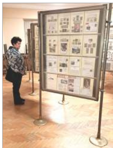
Pogled na del filatelistične razstave v Selcah

na poštah Škofja Loka, Železniki, S e l c a , Gorenja vas, Poljane in Žiri, od leta 1956, ko so škofjeloški filatelisti pripravili prvo filatelistično razstavo, pa vse do današnjih dni.