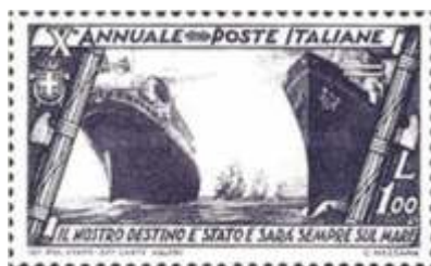
Slika 3. Znamka Italije predstavlja sceno iz filma Amarcord (1934). Znamko s podobno tematiko je izdala tudi pošta San Marina (1966) in Francije (2002).

dirke Mille Miglia. Toda resnični protagonisti so sanjarjenja mladih ljudi v mestu (Wikipedia).