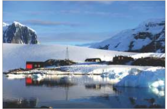
Port Lockroy, kot ga je v svoj objektiv ujela fotografinja Rachel Morris.

Pod Italijo so leta 1927 uredili v Koncertni dvorani, 1200 metrov od vhoda v Jamo, poštni urad, ki so ga opremili s čisto italijanskim žigom Postumia (Grotte) Trieste .