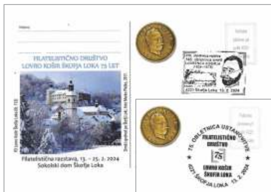
Ilustrirana kartica z veduto Škofje Loke in oba priložnostna žiga