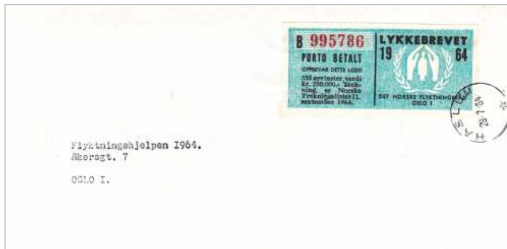
Spodnji del loterijske srečke, uporabljen kot poštna znamka

Tisti kupci, ki so kupili celoten zvežčič, so dobili vse tri dele. Ko so odtrgali srednji del, so lahko spodnji del uporabili kot veljavno znamko za 50 øre v notranjem prometu. Uporaba je bila možna le med 6. 6. in 10. 6. 1964. Celotno srečko so prodajali po 2,50 kron; od tega sta šli 2 kroni v korist navedenega sklada, 50 øre pa za poštnino. Osebo mi ni poznan noben podoben primer uporabe loterijske srečke (tudi) v poštne namene.