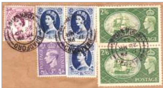
Primer mešane frankature med znamkami Jurija VI. in Elizabete II.

Prve visoke vrednote so izšle šele leta 1955, tri leta po kronanju kraljice. Do tedaj so se še uporabljale znamke s portretom prejšnjega kralja Jurija VI., ki so ostale frankaturno veljavne še naprej, le uporabljale so se manj. Na sploh so se lahko do 29. februarja 1972 (še dobro leto po uvedbi decimalnega sistema v Veliki Britaniji, kar se je zgodilo 15. februarja 1971) uporabljale preddecimalne znamke iz časov Jurija VI. in Elizabete II.