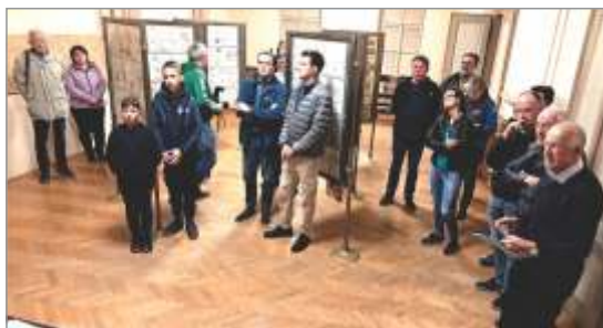
Odprtje filatelistične razstave v Krekovem domu v Selcah

Na tej darilni listini sta prvič omenjeni naselji Selca in Lonca, današnja Stara Loka. Razstava, ki smo jo od 23. do 30. oktobra 2023 pripravili v Krekovem domu v Selcah, v sodelovanju s Kulturnim društvom dr. Evangelist Krek Selca, je obsegala 20 razstavnih vitrin po 16 listov.